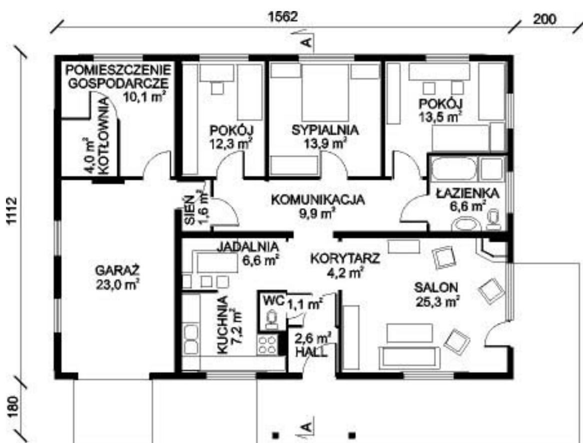
rzut I piętra