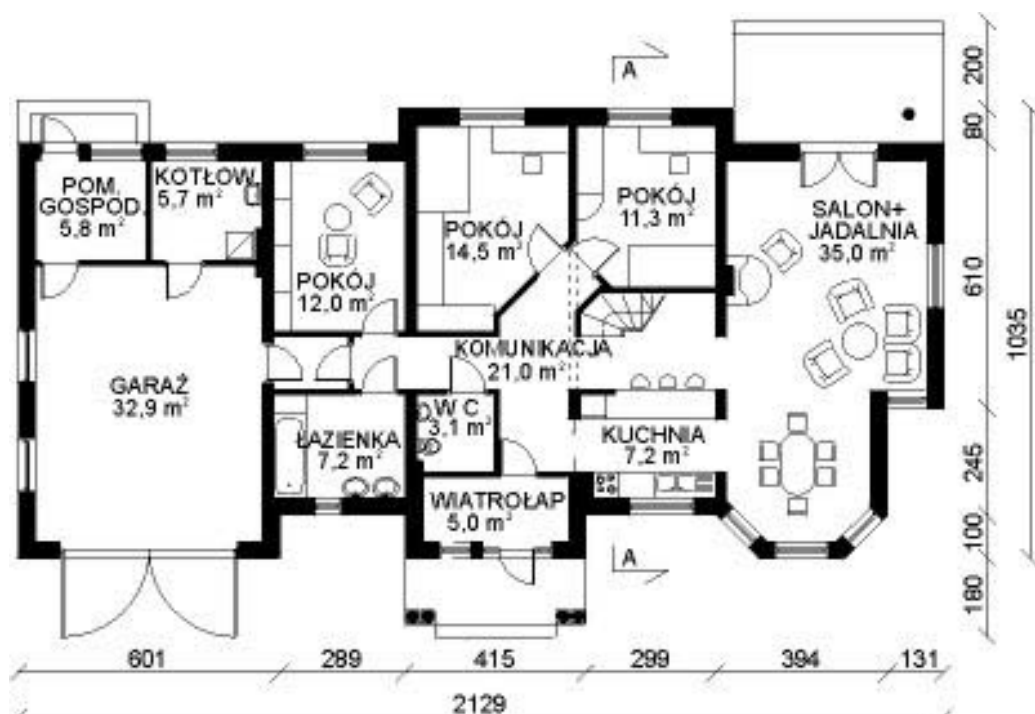
rzut I piętra