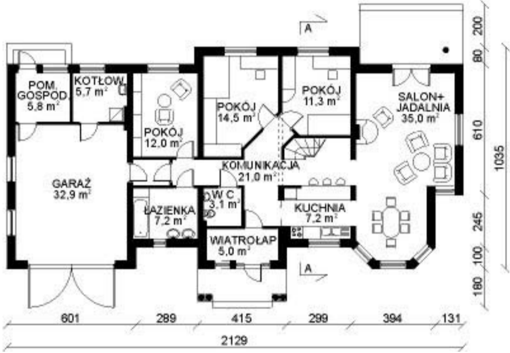
rzut I piętra